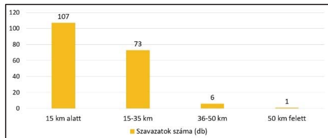
Egyes távok népszerűsége a mátrai túrázók körében kérdőíves felmérés alapján

Eredmények: Kérdőíves felmérésem válaszadóinak háromnegyed része nő, egynegyede férfi. Az életkor szerinti megoszlást tekintve a 40-59 évesek között mutatkozott legnépszerűbbnek a természetjárás (93 fő). 179 db kitöltő adta meg településének nevét, melyeket régiók szerint soroltam be. A legtöbb települést számláló régiók: Észak-magyarországi régió (28), Közép-magyarországi régió (20), Dél-alföldi régió (15). A túrázók 75%-a évente, vagy havonta néhány alkalommal járja a Mátra turistaútjait.